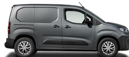
6FW - GRAU PLATIN