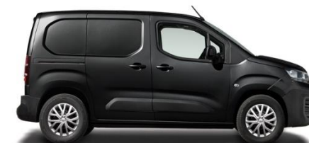
5DP - SCHWARZ PERLA