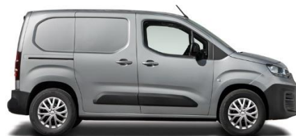
5DN - GRAU ARTENSE