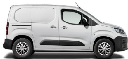
5DM - WEISS