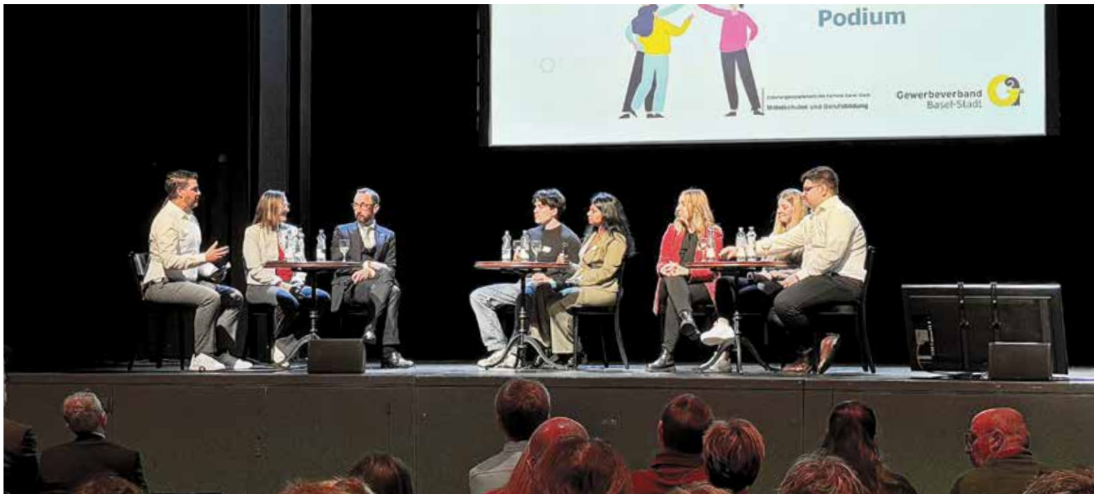
PODIUMSDISKUSSION ZUM THEMA PROJEKTE FÜR LERNENDE.